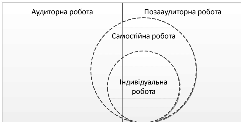
Рис. 1. Співвідношення обсягів суміжних педагогічних категорій

Звернімось до аналізу змісту та обсягу вказаних та споріднених понять у нормативно-правових актах. Пункт 3.9 Положення називає деякі різновиди індивідуальних завдань (далі – ІЗ): реферати, розрахункові, графічні, курсові, дипломні проекти або роботи. Цей пункт також розкриває специфіку цієї форми, зазначаючи, що ІЗ «виконуються студентом самостійно при консультуванні викладачем. Допускаються випадки виконання комплексної тематики кількома студентами» [3]. Останнє речення вказує, що нормативні акти уникають притаманного педагогічній теорії